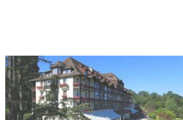
L'hôtel Ermitage Evian : détente dans un parc face au lac Léman Dans "Hôtels : test et avis des meilleurs hôtels de France et d'ailleurs"