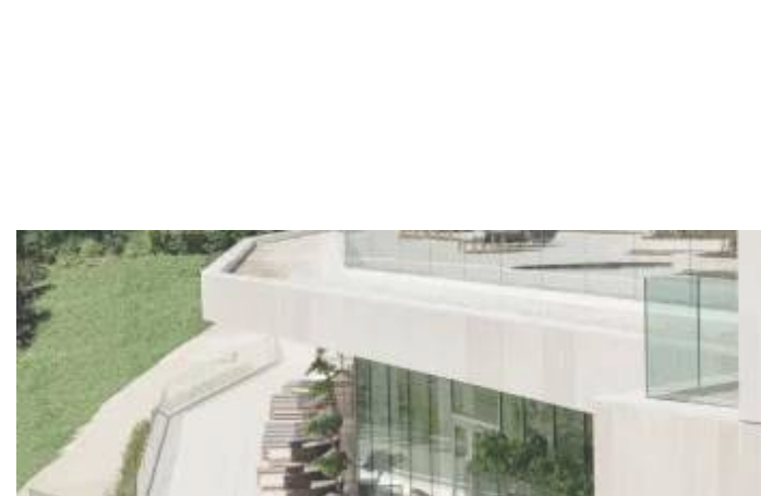
Le Royal Champagne : le plus bel hôtel spa proche de Paris Dans "Hôtels : test et avis des meilleurs hôtels de France et d'ailleurs"