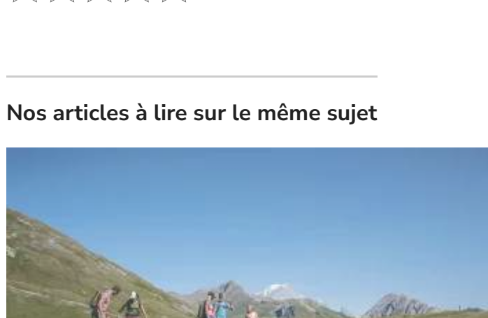
Week-end en montagne en été à l'hôtel ILY la Rosière Dans "Hôtels : test et avis des meilleurs hôtels de France et d'ailleurs"