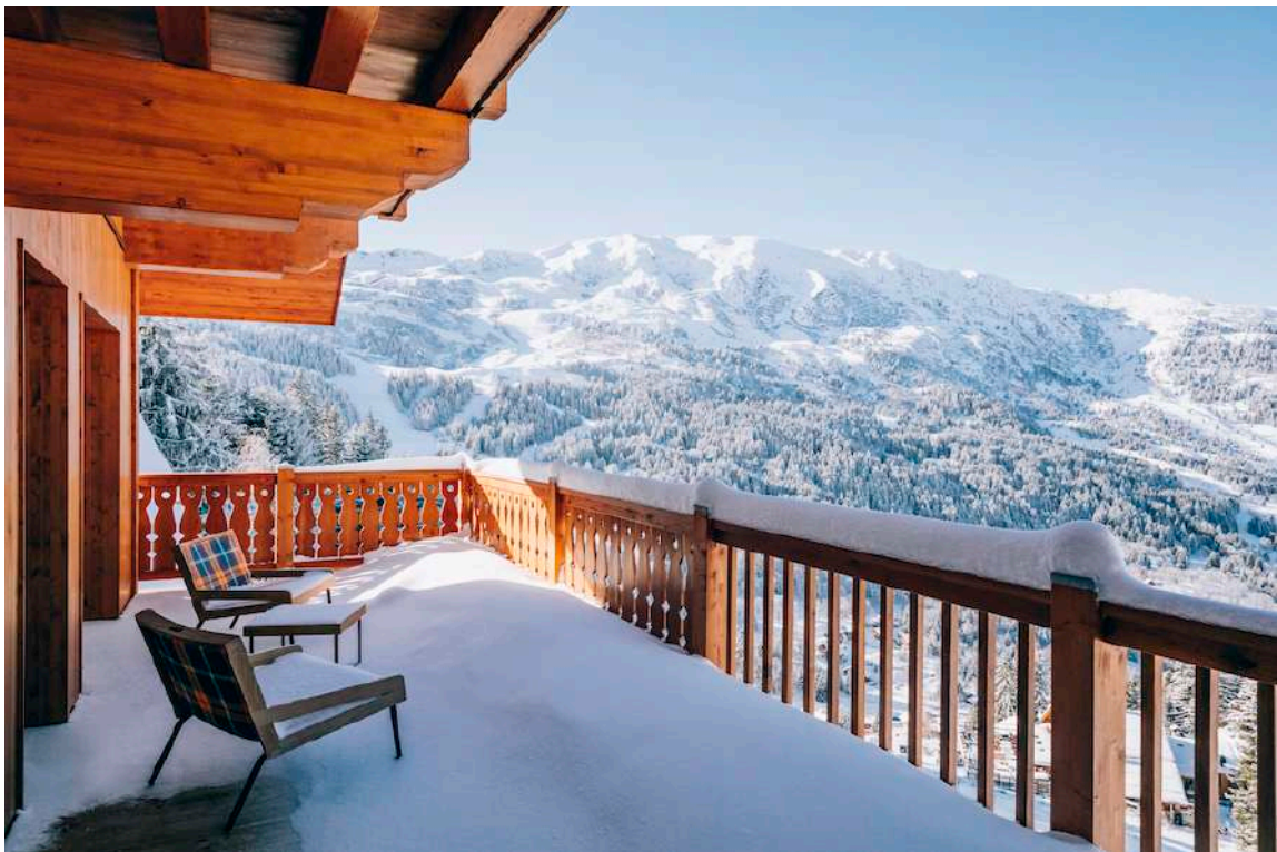
— Chambre avec vue.