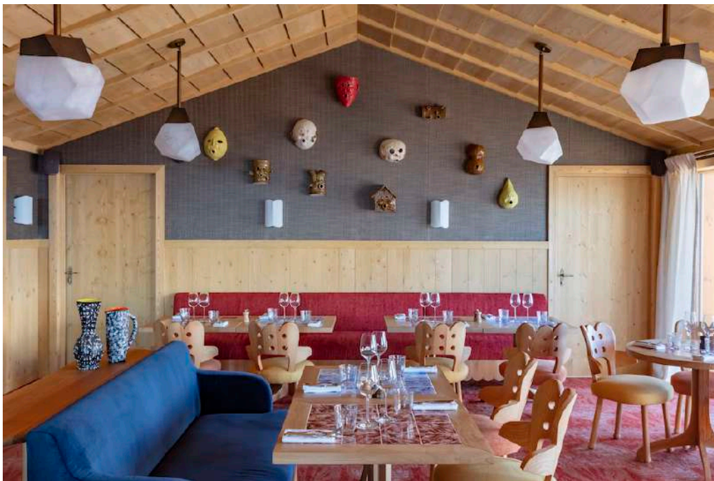
— Le Beefbar, l'un des deux restaurants de l'hôtel.

Outre ses 55 chambres, dont 39 suites, ses deux chalets privés à louer, indépendants mais connectés à l'hôtel par un passage intérieur, et sa skiroom de compète, Le Coucou propose une offre alternative pour profiter de l'établissement autant que de son paysage environnant. Au programme des expériences à vivre : un bar, idéal pour le cocktail du soir ou le buffet gourmand du goûter, deux restaurants orchestrés par Riccardo Giraudi , avec un Beefbar pour les amateurs de viandes et une table italienne aux spécialités toscanes, un fumoir, un Kids Club et un Teens Lab (l'hôtel se veut super kids friendly!), une piscine intérieure bordée d'arcades et un bassin extérieur dans son prolongement, un espace forme avec sauna-hamman-jacuzzi, une salle de fitness, avec cours de yoga, et un réjouissant spa Tata Harper où se ressourcer en beauté, occasion idéale pour découvrir les soins et produits de cette marque pionnière du bio. Mention spéciale pour le Soin Visage Signature Le Coucou qui revigore, protège et hydrate. Ou la parfaite définition de l'échappée belle.